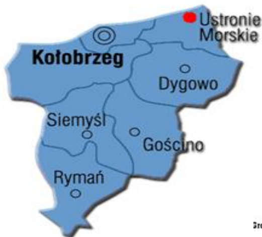
rys. 1 mapa położenia Gminy Ustronie Morskie w Powiecie

Powierzchnia gminy wynosi ok. 57,0 km 2 . Ustronie Morskie jest jedną z najmniejszych